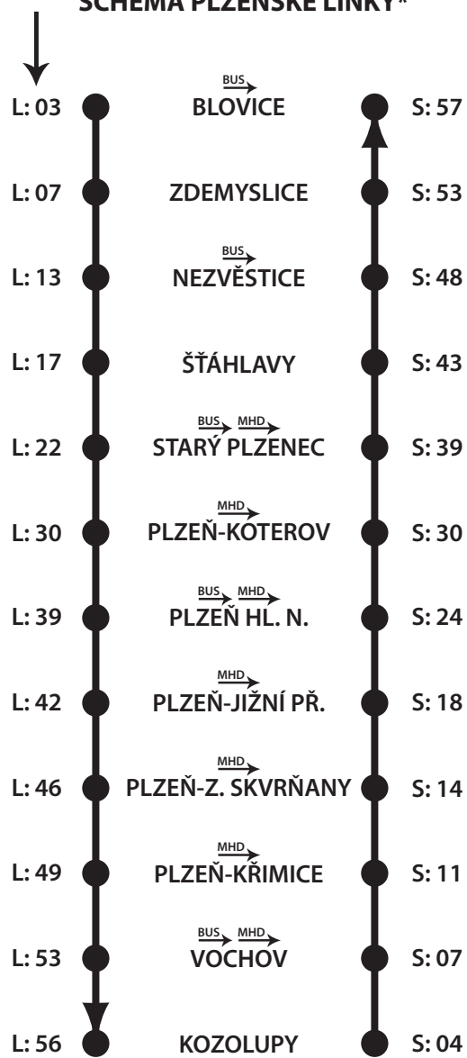
SCHÉMA PLZEŇSKÉ LINKY*

Plzeňská linka tak přinese kvalitní dopravu pro satelity v blízkém okolí města Plzně s možností přepravy v rámci města Plzně po železnici bez přestupu na hlavní nádraží. Plzeňská linka bude zařazena do systému Integrované dopravy Plzeňska . Rozšíří se tak počet vlakových spojů, na kterých budou moci cestující využívat předplatné na Plzeňské kartě .