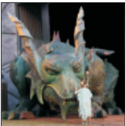
Furthský drak/Further Drache

TOP-Ausflugsziele: Drachendomuseum, Drachenhöhle, Drachensee, Wildgarten, Erlebniswelt Flederwisch, Felsengänge, Wildgehege Steinbruchsee, etc.