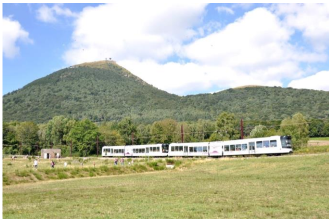
Na Puy de Dôme vozí turisty moderní vláček

každoročně cílem mnoha tisíc turistů hlavně z Francie. Přístupová komunikace, která obtáčí horu podobně, jako když Jan Žižka dobýval hrady, teď slouží již jen jako servisní komunikace. Na