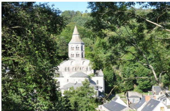
Románský kostel a šedé břidlicové střechy patří k Orcivalu

Zatímco v Clermont-Ferrand najdeme gotickou katedrálu se štíhlými věžemi, v Orcivalu či Saint-Nectaire jsou to monumentální románské stavby s břidlicovými střechami, jaké v Česku nemáme. Právě šedá břidlice dotváří jedinečný pohled na půvabné městečko Orcival ležící