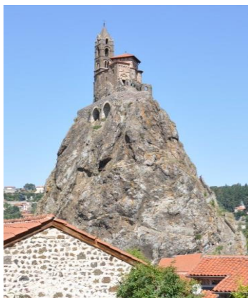
Kaple St. Michel na jedné ze sopečných homolí v Le Puy-en-Velay

Ve Francouzském středohoří pramení mnoho řek na rozvodí mezi Středozezemním mořem a Atlantským oceánem. Nachází se tu nespočet kamenných hradů, krásných údolí, jeskyní i menších soutěsek. Oblast je ve srovnání s jinými regiony Francie méně obydlena. Mezi městy tu ale najdete jednu perlu. Je jím město Le Puy-en-Velay se sopečnými homolemi uprostřed i na okrajích. Výstup k několikametrové soše Panny Marie na vulkanickém kopci patří ke standardní prohlídkové trase města.