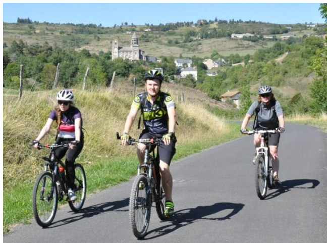
V Saint Nectaire s románskou katedrálou se vyrábí známý sýr

mezi Puy de Dôme a nejvyšším vrcholem dalšího menšího pohoří Monts Dore . Pod jeho nejvyšší horou Puy de Sancy , která je pozůstatkem stratovulkánu, se ukrývá lázeňské město Mont Doré , které se během zimy mění v oblíbené lyžařské středisko se sjezdovkami hlavně na jižní straně hřebene. Při výstupu z údolí, kde pramení řeka Dordogne , lanovkou na Puy de Sancy (1860 m) uvidíte, jak přirozeně zapadají šedé břidlicové střechy Mont Doré do zdejší přírody.