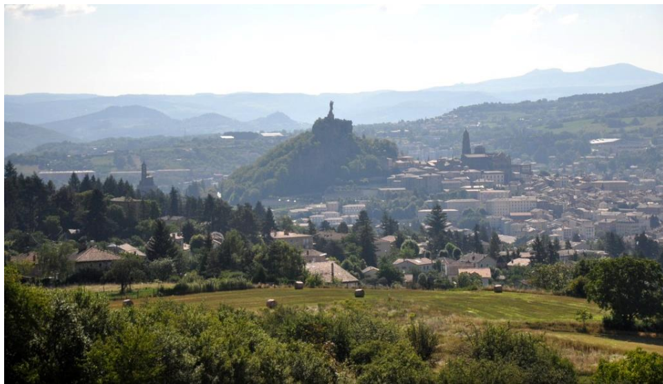
Le Puy-en-Velay - město s dominantami na sopečných homolích

Lahodná chuť Cantalu se v obřích bochnících výšky a průměru 40 cm, či menších o průměru a výšce 20 cm, postupně vyvíjí, a tak si jej zde můžete koupit ve třech různých stupních vyzrálosti: mladý (jeune), střední (entre-deux) či starý (vieux), který zraje minimálně půl roku. Krávy se pasou na planinách ve vyšších nadmořských výškách hlavně v pohoří Cantal, jež vzniklo jako pozůstatek obřího stratovulkánu, v jehož kráteru jsou tři největší vrcholky pohoří Monts de Cantal – Plomb de Cantal, Puy de Rocher a Puy de Peyre Arse .