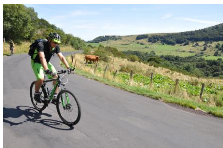
Věčně zelené údolí Chaudefour

Auvergne je kraj ve střední Francii. Je částí tzv. Francouzského středohoří ( Massif Central ), které tvoří několik menších pohoří, z nichž nejzajímavější je Řetěz vrcholků ( Chaîne des Puys ) s pozůstatky velice mladých, jen několik tisíc let starých, sopek. Vrchol té nejvyšší Puy de Dôme je