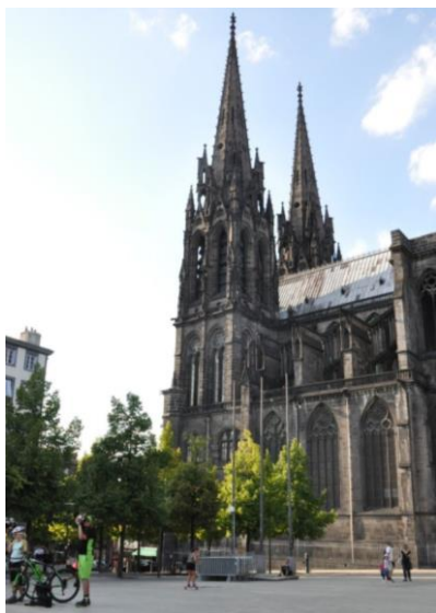
Katedrála v Clermont-Ferrand je postavená z černého lávového kamene

moderním vyhlídkovým vláčkem. Pozůstatky Merkurova chrámu na vrcholu svědčí o významu hory již v době, kdy tuto oblast spravovali Římané. To, co láká mnohem více, je procházka po koruně kráteru s vyhlídkou na pár sopečných „puy“ (francouzsky vrchol kopce) táhnoucí se na sever i na jih. Na některé z nich se dá také vystoupat, jiné musely být pro drolící se lávu pod nohama opatřeny dřevěnými chodníky/lávkami, nebo byl přístup na korunu kráteru zcela zakázán.