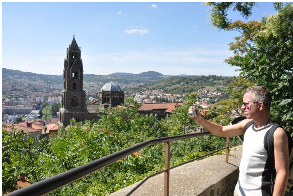
Vyhledka ze sopečné homole se sochou Panny Marie zláká snad každého turistu k výstupu.