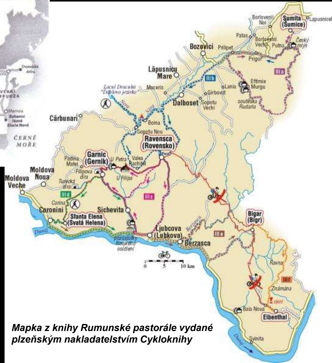
Mapka z knihy Rumunské pastorále vydané plzeňským nakladatelstvím Cykloknihy